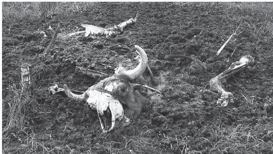
Ryc. 3. Szkielet żubra na torfowisku J. Szkliste.