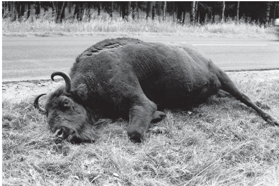
Ryc. 2. Samica żubra zabita przez samochód przy drodze krajowej nr 10, okolice Piecnika.