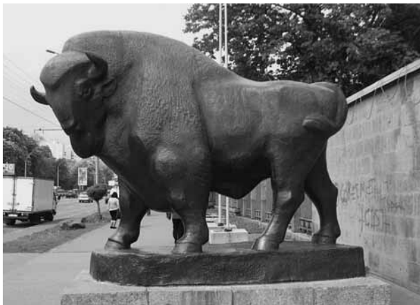
Rycina 3. Największy pomnik żubra w Europie przed wejściem do Kijowskiego Zoo

W 2003 r. Narodowy Bank Ukrainy wyemitował srebrne monety wartości 2 oraz 10 hrywien z wizerunkiem żubra, według szkicu W. Demjanenki (Ryc. 5). W tym przypadku główną motywacją obrania tego zwierzęcia spośród innych chronionych gatunków była właśnie jego ogromna postura.