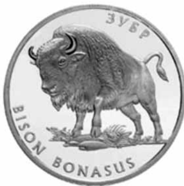
Rycina 5. Srebrne monety wartości 2 oraz 10 hrywien z wizerunkiem żubra